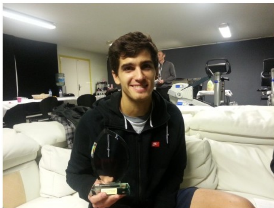
Pierre-Hugues Herbert vainqueur des tableaux simples et doubles du 4e Open de tennis de Quimper

L'Alsacien de 22 ans, 156e mondial, est le premier joueur de la courte histoire de l'Open de tennis de Quimper à s'imposer en simple comme en double.