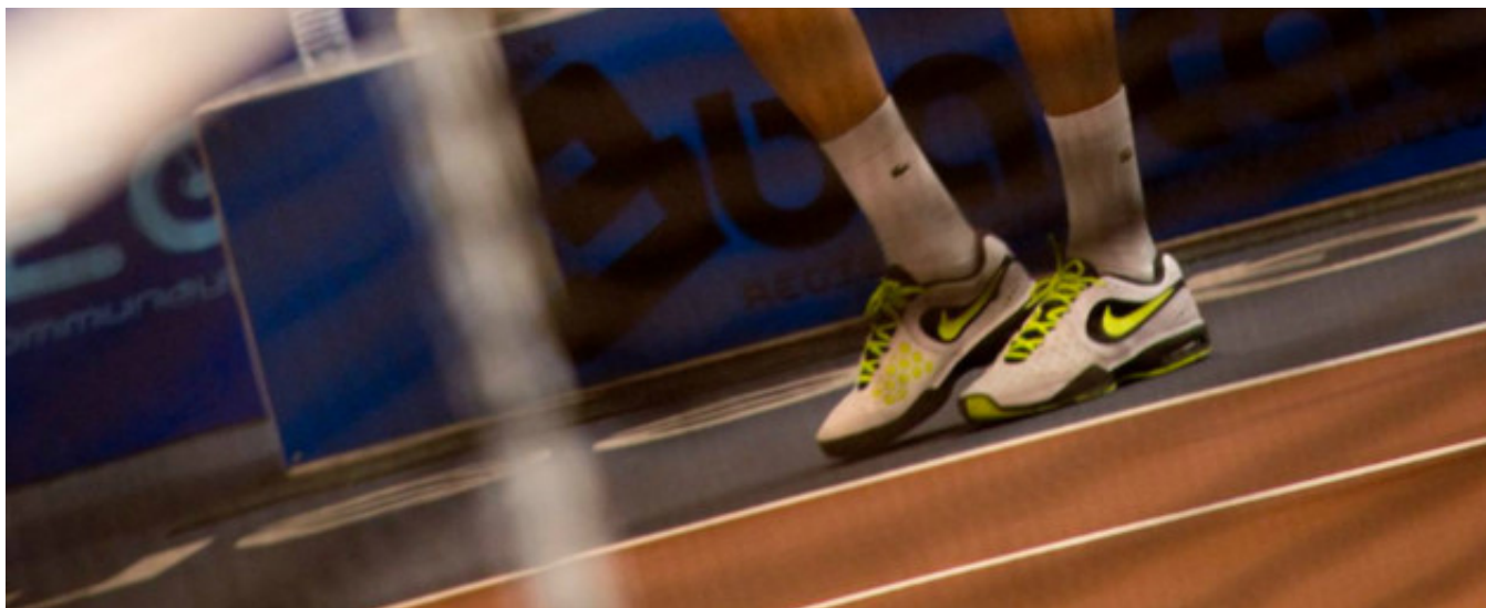
Benoît Paire.