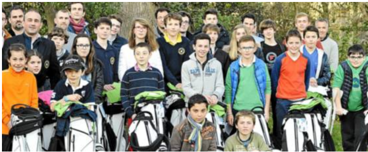
Accompagnés de leurs dirigeants et partenaires, les jeunes récipiendaires des équipements marqués aux couleurs du club et des deux entreprises sponsors voisines.