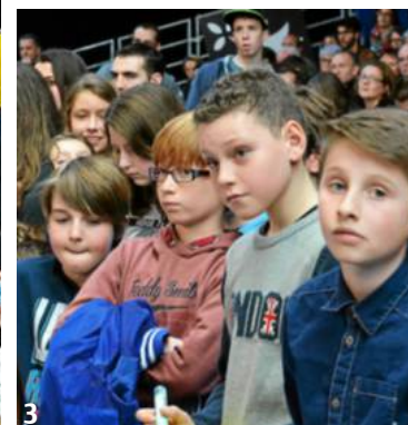
1. La finale de l'Open quimpérois a attiré la foule, hier après-midi. 2. Benoît Paire est le vainqueur de cette édition 2015. 3. Les jeunes passionnés de tennis ont été particulièrement attentifs, hier.

L'Open de tennis s'est achevé hier après-midi, sur la victoire de Benoît Paire. Un beau vainqueur pour cette cinquième édition plébiscitée par le public. Les organisateurs réfléchissent désormais à un possible déménagement vers le pavillon de Penvillers, l'an prochain.